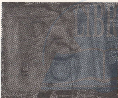
Mănăstirea Vatopedi – Arsanaua, placa cu ctitorul – Ștefan cel Mare