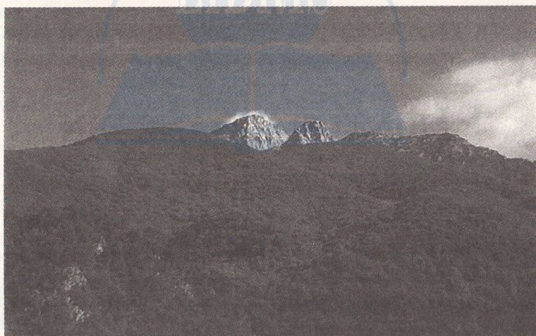
Vedere spre Vârful Athon