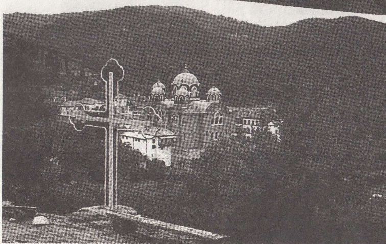
Schitul Sfântul Ilie