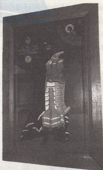
Domnitorul Mihai Viteazul, ctitor al Mănăstirii Simonos Petra